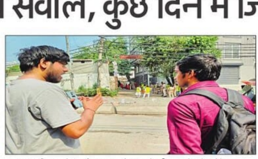
मलबा निकालने के दौरान कुछ लोग हादसे की जगह देखने पहुंचे। संवाद

एफएमजीई अर्थव्यवस्था के अनुसार इमारत का ढहना एक बड़ा नुकसान है, उससे भी बड़ा नुकसान उनकी पढ़ाई की सामग्री का है। सात पर की मेहनत और तैयारी एक झटके में प्रभावित हो गई है। हादसे के बाद बचाव दल को मलबे के बीच किताबें, नोट्स, पहचान पत्र, एडमिट कार्ड और अन्य दस्तावेज बिखरे मिले। छात्रों का कहना है कि इन दस्तावेजों और नोट्स को दोबारा तैयार करना लगभग असंभव है।