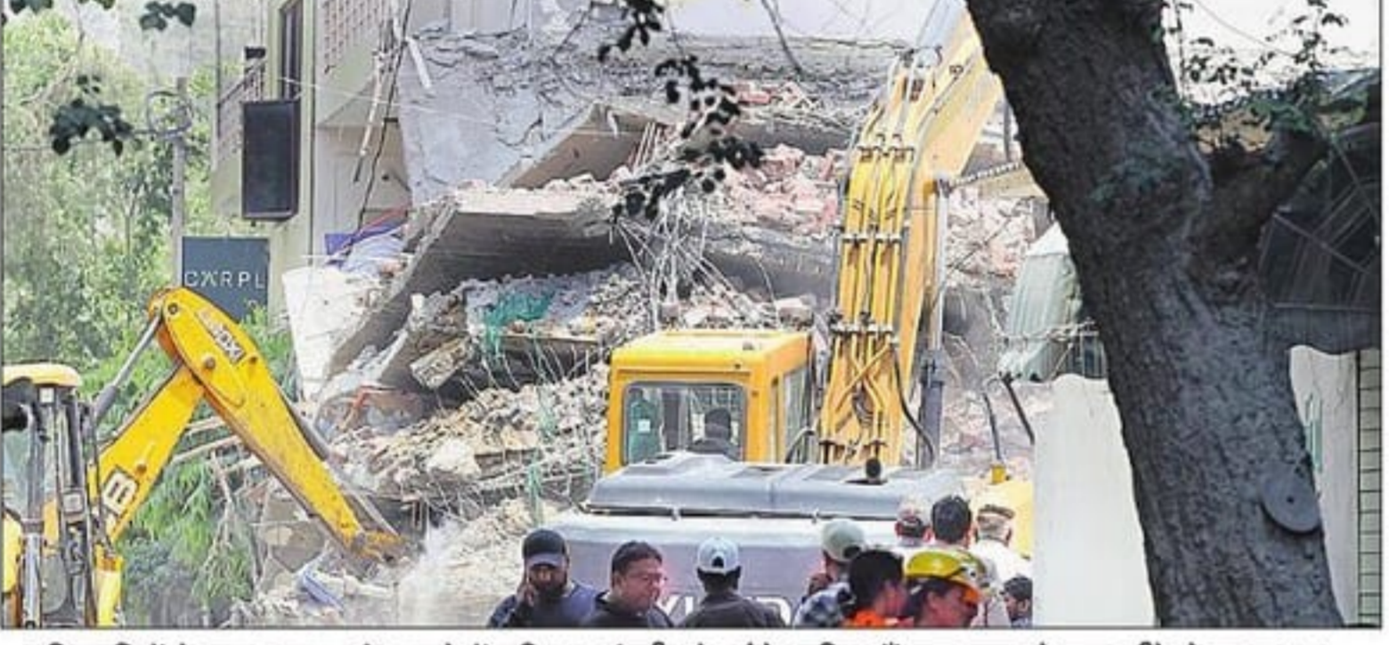
अधिकारियों ने कहा, इमारत के मलबे में सरिया व कंक्रीट के ढांचे शामिल हैं, इस वजह से काम धीरे हो पा रहा। संवाद

नई दिल्ली। सैदुल्लाजाब में इमारत ढहने की घटना महज एक हादसा नहीं, बल्कि वर्षों की प्रशासनिक लापरवाही का परिणाम है। साकेत मेट्रो स्टेशन के निकट शनिवार शाम हुए हादसे ने पांच युवा डॉक्टरों और एक कैटीन संचालिका समेत छह लोगों की जान ले ली। पुलिस के अनुसार अधिकांश मृतकों की मौत मलबे में दबने के बाद दम घुटने से हुई है। दिल्ली पुलिस के वरिष्ठ अधिकारियों के अनुसार यह त्रासदी अचानक नहीं हुई। उपलब्ध दस्तावेज और प्रशासनिक रिकॉर्ड बताते हैं कि भवन को वर्ष 2015 में ही दिल्ली नगर निगम (एमसीडी) ने अवैध निर्माण के रूप में चिह्नित कर लिया था। करीब 700 वर्ग गज में बने इस भवन के खिलाफ कार्रवाई का आश्वासन भी दिया गया। मामला 2021 में दिल्ली हाईकोर्ट तक पहुंचा। अदालत के निर्देशों के बाद एमसीडी ने भी स्वीकार किया कि भवन अवैध है और इसे ध्वस्त किया जाना चाहिए। बावजूद न तो भवन को गिराया गया और न ही उसे खाली कराया गया।