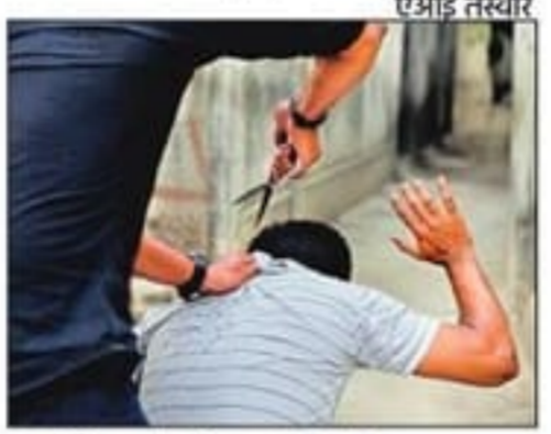
मौके से ही आरोपी गिरफ्तार पुलिस कर रही मामले की छानबीन

जगजीवन राम अस्पताल लेकर जा चुके हैं। जहां पहुंचने पर पुलिस को पता चला कि डॉक्टरों ने उसे मृत घोषित कर दिया गया है। शुरुआती