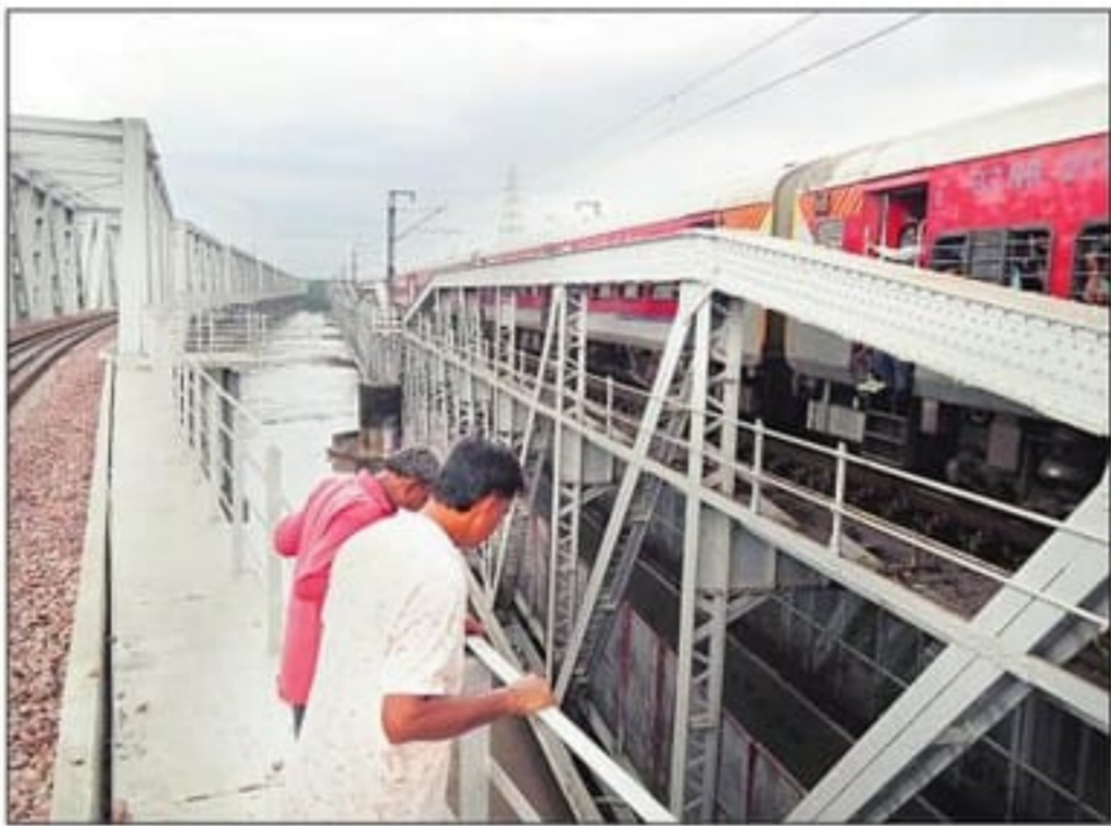
पुराने लोहे वाले पुल के बगल में बना नया रेलवे पुल।

नई दिल्ली। अब बारिश के मौसम में भी पुरानी दिल्ली से आने-जाने वाली ट्रेनों के पहिये नहीं थमेंगे। पहले बारिश के मौसम में यमुना के खतरे के निशान पर आते ही लोहे वाले पुल तक पानी टकराने लगता है। इस कारण पुरानी दिल्ली आने वाली ट्रेनों के पहिये थम जाते थे। अब लोहे के पुल के नजदीक ही बड़ा ब्रिज बनकर तैयार है जो पुराने पुल से करीब तीन मीटर ऊंचा है। पिछले कुछ दिनों से पुल पर ट्रेनों का ट्रायल किया जा रहा है। ट्रायल सफल रहने पर इसे पूरी तरह से खोल दिया जाएगा। इसका उद्घाटन प्रधानमंत्री कर सकते हैं। नया पुल बनाने की योजना को 1997-98 में अप्रूवल मिला और 2003 में निर्माण कार्य शुरू किया गया। हालांकि, इसमें लगातार विलंब होता रहा। अधिकारियों का कहना है कि भारतीय पुरातत्व सर्वेक्षण (एएसआई) व अन्य एजेंसियों से अप्रूवल लेना पड़ा था। इस कारण करीब पांच साल विलंब