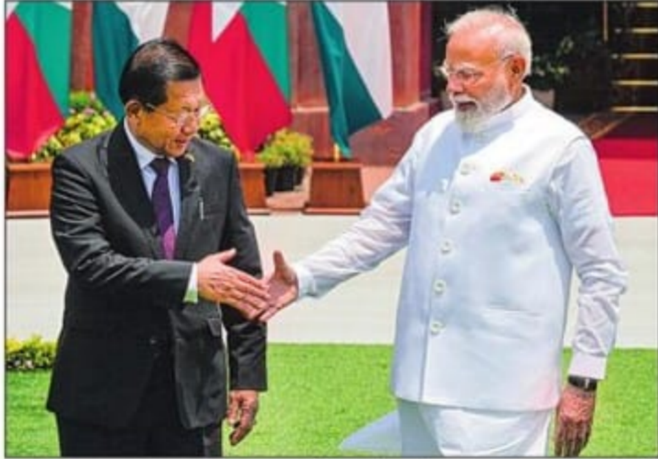
म्यांमार के राष्ट्रपति यू मिन के साथ नई दिल्ली के इंटरबाद हाउस में पीएम मोदी।

नई दिल्ली। म्यांमार ने आश्चर्य किया है कि वह अपनी धरती का इस्तेमाल भारत विरोधी गतिविधियों के लिए नहीं होने देगा। भारत दौरे पर आए म्यांमार के राष्ट्रपति यू मिन आंग ह्लाइंग और प्रधानमंत्री नरेंद्र मोदी के बीच वार्ता में महत्वपूर्ण एवं दुर्लभ खनिजों के क्षेत्र में आपसी सहयोग बढ़ाने पर भी सहमति बनी। दोनों नेताओं ने रक्षा-सुरक्षा, सीमा प्रबंधन, व्यापार और कनेक्टिविटी सहित कई अन्य मुद्दों पर भी चर्चा की। पीएम मोदी ने वार्ता के दौरान म्यांमार की संप्रभुता एवं अखंडता के लिए भारत का समर्थन दोहराया। कहा-भारत वहां शांति-स्थिरता की कोशिशों का समर्थन करता है। दोनों नेताओं ने जोर दिया कि किसी भी देश की धरती का इस्तेमाल एक-दूसरे के सुरक्षा हितों के खिलाफ नहीं होने दिया जाएगा। राष्ट्रपति ह्लाइंग ने भारत को आश्चर्य किया-म्यांमार की धरती का उपयोग भारत के सुरक्षा हितों के खिलाफ बिल्कुल नहीं होने दिया जाएगा। म्यांमार भारत के रणनीतिक पड़ोसियों में से एक है और कई पूर्वोत्तर राज्यों के साथ 1,640 किलोमीटर