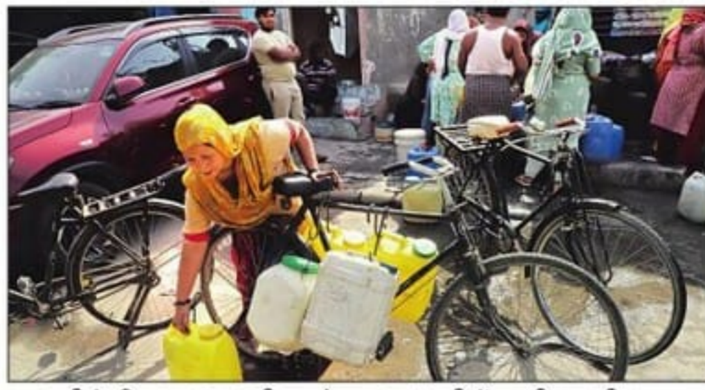
पानी के लिए इस तरह की जद्दोजहद राजधानी में करनी पड़ रही। फाइल