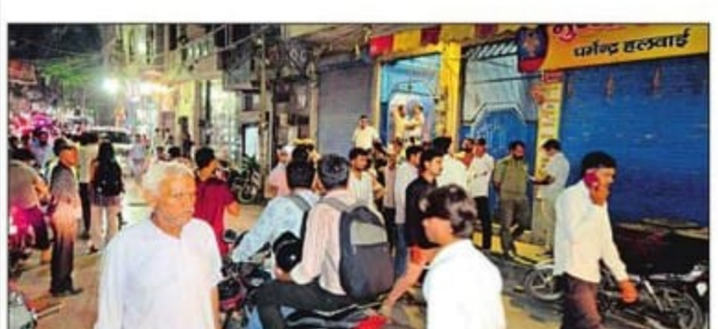
न्यू उस्मानपुर इलाके में इसी जगह बदमाशों ने की फायरिंग।

नई दिल्ली। उत्तर-पूर्वी दिल्ली के न्यू उस्मानपुर इलाके में रविवार शाम हुई फायरिंग की घटना में एक 12 वर्षीय बच्चा गोली लगने से घायल हो गया। बदमाश एक कैटरर के घर के बाहर गोलियां चला रहे थे, तभी वहां से गुजर रहे बच्चे के पैर में गोली लग गई। पुलिस ने पिकेट लगाकर वारदात के बाद भाग रहे दो आरोपियों को गिरफ्तार किया है। न्यू उस्मानपुर थाना