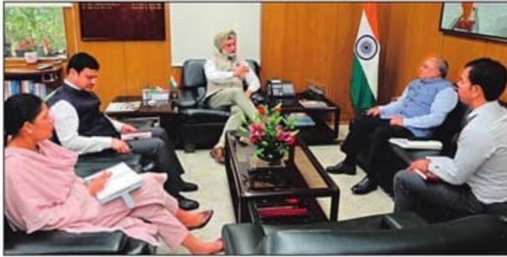
उपराज्यपाल संघु सीएक्सयूएम अध्यक्ष के साथ बैठक करते हुए।

ड्रेनेज सिस्टम और सड़क मरम्मत पर बढ़ेगी सख्ती : नालों