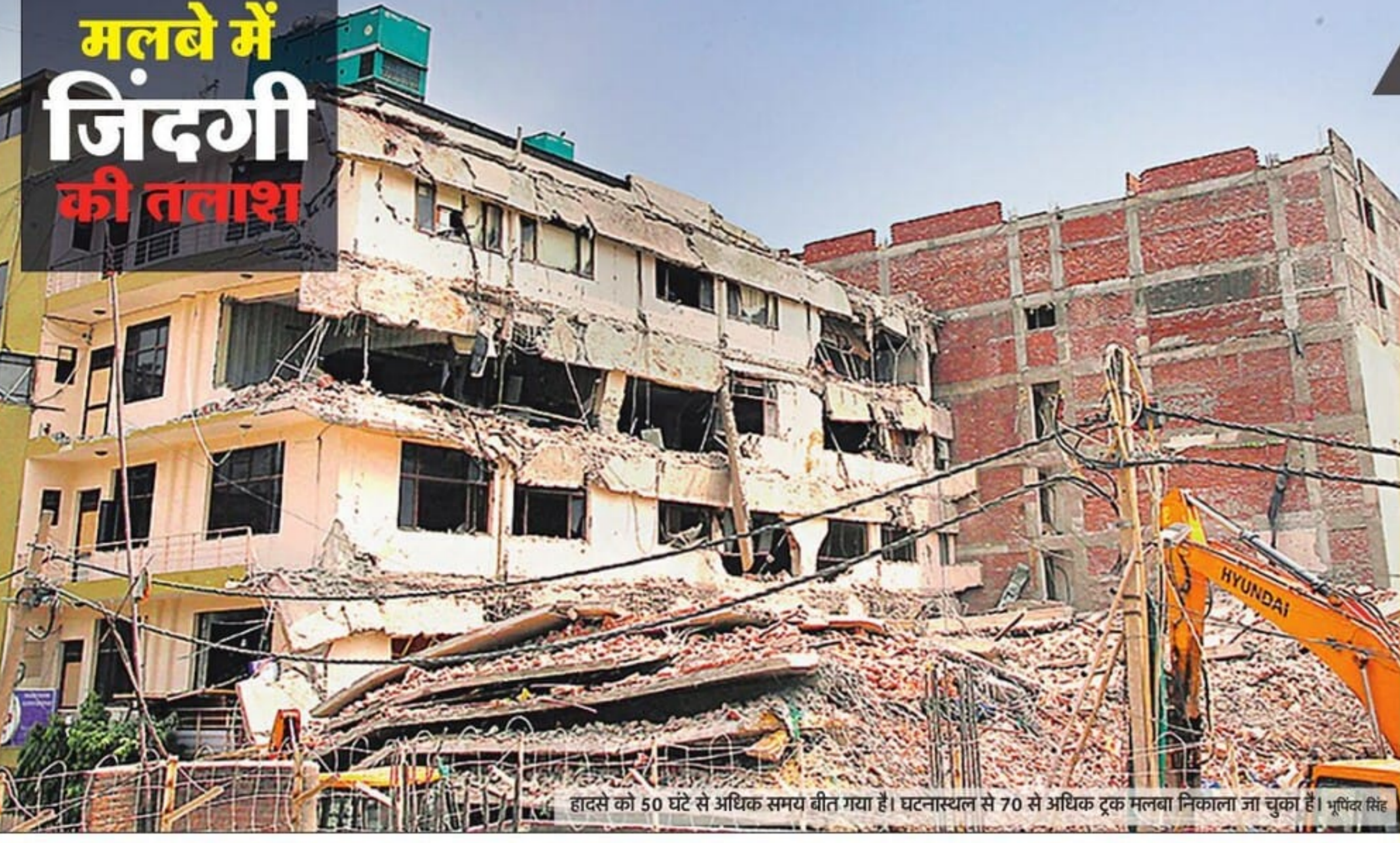
हादसे की 50 घंटे से अधिक समय बीत गया है। घटनास्थल से 70 से अधिक ट्रक मलबा निकाला जा चुका है। भूषिक सिंह